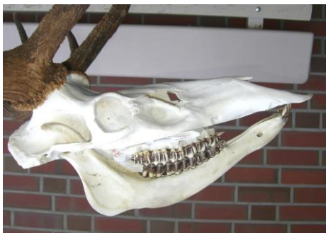
(4) Rothirsch mit verkürztem Unterkiefer