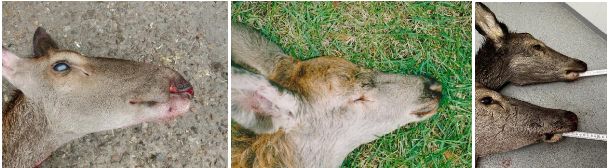
Links: (1) Kalb mit verhornten Augen und Schädelmissbildungen; Mitte: (2) Kalb ohne Augen; Rechts: (3) Kuh und Kalb mit stark verkürzten Unterkiefern.

Vier Beispiele von missgebildeten Rothirschen aus Schleswig-Holstein und eins aus Dänemark. Nachweise gibt es mittlerweile aus allen Rotwildvorkommen im Land sowie aus Dänemark.