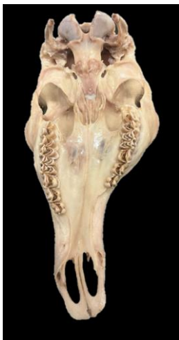
(5) Rothirsch mit stark verdrehtem Schädel und Oberkiefer aus Dänemark